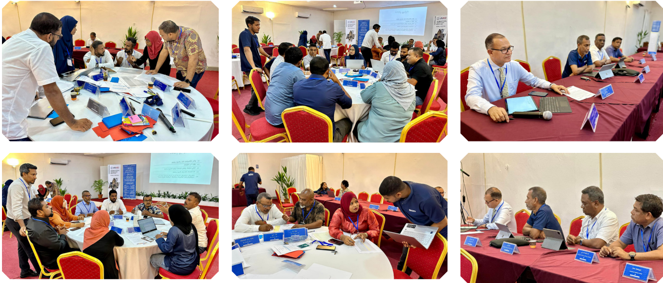
دېرىنچىلىرى ۋە باشقا كۈتۈپخانا ئىشلىرى، كۈتۈپخانا مەركىزى رەئىس قۇربان 2024